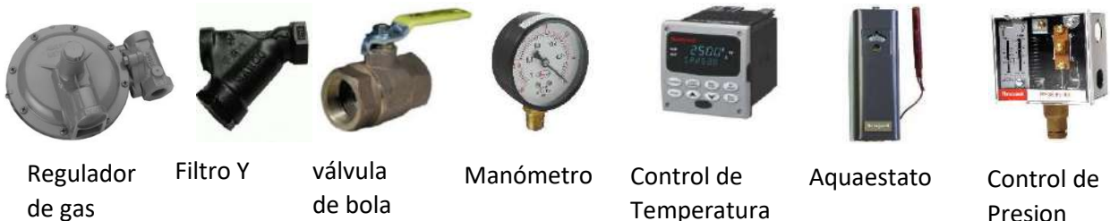
Regulador de gas