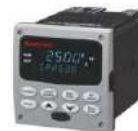
Control de Temperatura