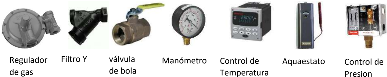
Regulador de gas