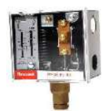
Control de Presion

para más información visita nuestra pagina web.