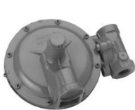
Regulador de gas