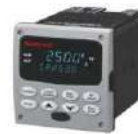
Control de Temperatura