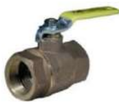
válvula de bola