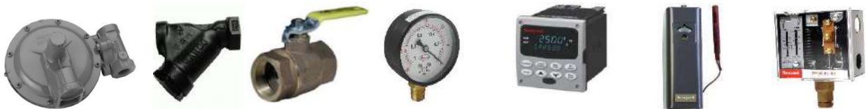
Regulador de gas